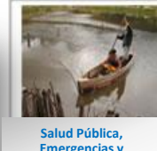
Salud Pública, Emergencias y Desastres