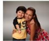
Vida Saludable y Condiciones no Transmisibles