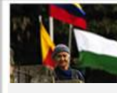
Vida Saludable y Enfermedades Transmisibles