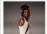
Salud y Ámbito Laboral