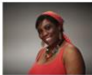
Convivencia Social y Salud Mental